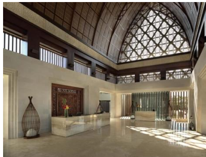
Gambar 2. Interior Golden Tulip Jineng Resort

Dapat dilihat pada bangunan yang menjadi icon dari Hotel Golden Tulip tersebut, yaitu bangunan yang berbentuk Jineng. Jineng merupakan bangunan tradisional Bali yang fungsinya dipergunakan sebagai tempat menyimpan hasil panen seperti padi. Namun pada arsitektur modern di Bali saat ini, sangat jarang masyarakat yang membangun jineng pada rumahnya. Namun saat ini jineng tidak hanya dapat digunakan sebagai tempat menyimpan hasil panen, namun jineng juga dapat digunakan sebagai tempat hunian dengan adaptasi desain modern.