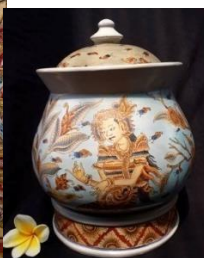
Gambar 3. Sangku Keramik Varian 1.