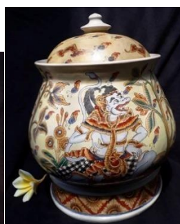
Gambar 4. Sangku Keramik Varian 2.