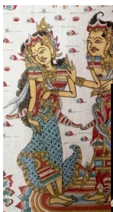
Gambar 2. Contoh Lukisan Wayang Style

Dengan demikian perwujudan karya ini lebih mengedepankan nilai keindahan dibandingkan nilai yang lainnya. Karena karya sangku keramik ini menampilkan ornamen yang dibuat melebihi konsentrasi yang lainnya. Hendriyana menyebutkan karya seni kriya dikelompokkan menjadi 3 yaitu karya kriya yang lebih cenderung menampilkan nilai keindahan (artistik/estetik), karya kriya yang lebih cenderung menampilkan kualitas teknik pengerjaan dan karya kriya yang lebih cenderung menampilkan nilai fungsi dan kepraktisan bentuk (Hendriyana: 2018: 6). Dari uraian di atas karya sangku keramik ini termasuk kelompok karya kriya yang pertama yaitu karya kriya yang lebih cenderung menampilkan keindahan. Semua hasil dari proses perwujudan sangku keramik ini seperti terlihat pada gambar 3, 4, 5 berikut.