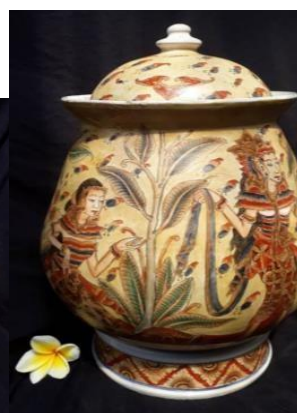
Gambar 5. Sangku Keramik Varian 3.