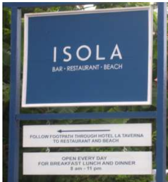
Gambar 2. Papan Nama Isola Bar, Restaurant And Beach Dilihat dari Jarak Dekat