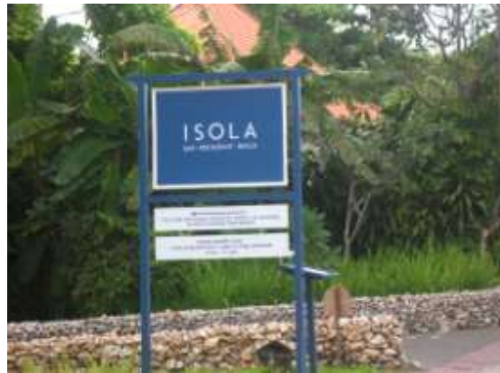
Gambar 1. Papan Nama Isola Bar, Restaurant And Beach

perusahaan lain disebelah utaranya. Untuk lebih jelasnya dapat dilihat pada gambar 1 dan gambar 2.