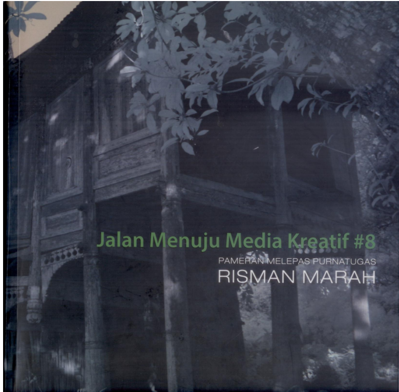
Cover catalog pameran