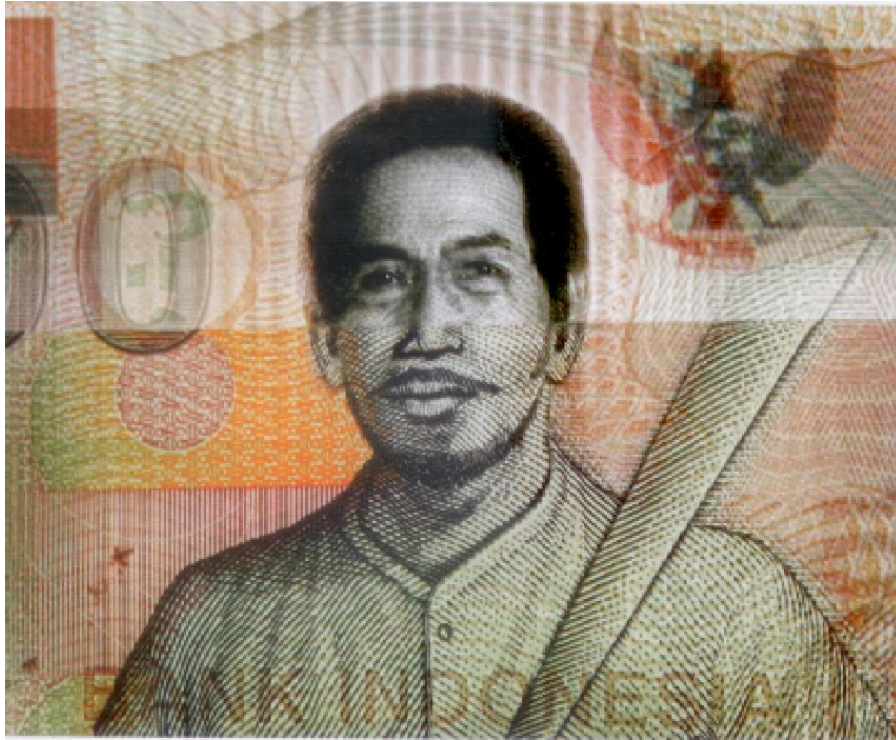
Judul Karya : Pejuang