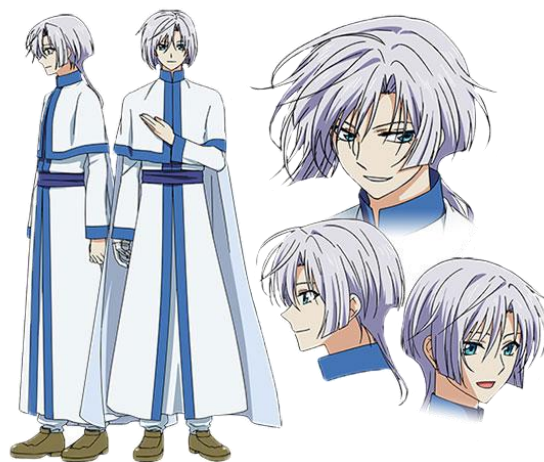
Kija / Hakuryuu

Pemain karakter selanjutnya bernama Yoon. Yoon sebenarnya sangat benci keluarga kerajaan, dia hidup dengan seorang biksu yang bernama Ik-su. Yoon bisa melakukan hal apa saja, dia sangat ahli dalam obat-obatan. Desain karakter Yoon sangat simpel dengan wajah yang terlihat seperti perempuan dan warna rambut yang berwarna oranye kecoklatan, dihiasi dengan hiasan bulu pada rambutnya membuat ekspresinya terlihat seperti perempuan. Yoon menggunakan baju (tidak berupa jubah) berwarna hijau dengan slayer di leher berwarna biru, mengenakan tas yang dipenuhi obat-obatan, celana berwarna putih dengan sepatu boot hangatnya berwarna coklat.