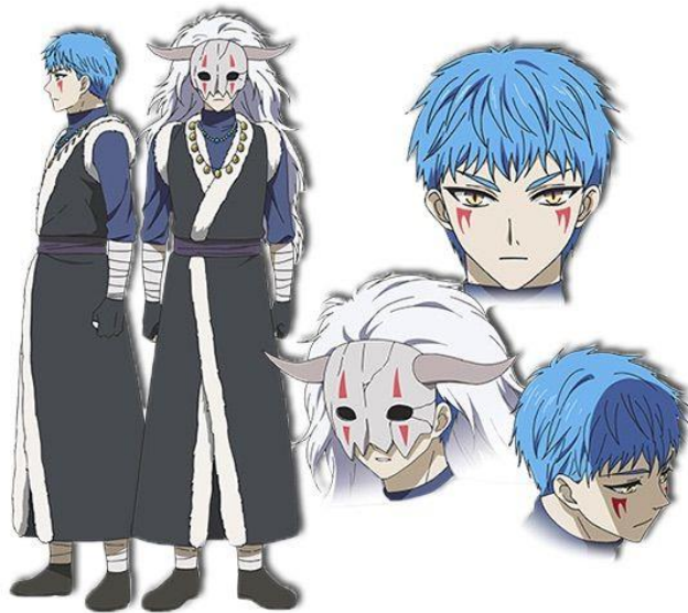
Sin-ha / Seiryu

Karakter selanjutnya adalah Hakuryuu atau Naga Putih. Ia memiliki cakar besar seperti naga di tangan kanannya. Ki-Ja merupakan prajurit naga yang pertama ditemukan Putri Yona. Dengan bantuan Ki-ja, Putri Yona lebih mudah untuk menemukan Naga Biru atau Seiryu. Desain pakaian Kija berupa jubah putih panjang dengan hiasan rompi putih berpinggiran berwarna biru. Kija juga memiliki wajah yang terkesan cantik dan perawakan yang ceria, rambut yang berwarna perak dan desain mata lebar berpupil biru.