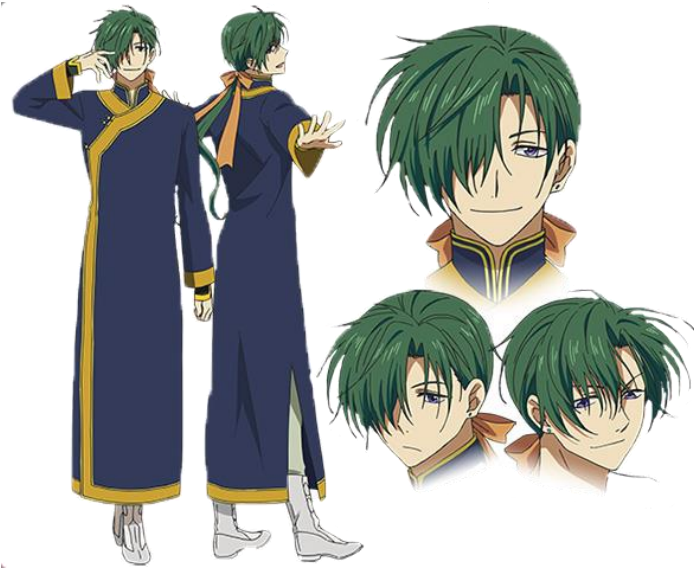
Jae-Ha / Ryokuuryu

Jae-Ha adalah karakter naga hijau. Karakter naga hijau atau Ryokuryuu diberi wajah yang cool dengan mata sipitnya yang memiliki warna pupil biru keunguan. Jaeha memiliki kekuatan di kaki kanannya. Kekuatan naga hijau yang dapat melompat tinggi dan menendang lawannya dengan sangat keras. Jae-ha memiliki sifat atau perwatakan yang royal dan sedikit genit. Rambutnya yang berwarna hijau dan panjang terikat dengan sebuah pita berwarna orange memberikan kesan tegas di wajahnya. Desain baju Jae-ha berasal dari Kai Emperor (sebuah negara yang bermusuhan dengan Kouka Kingdom atau kerajaan yang di tempati oleh Putri Yona), yang berwarna biru dengan lis pinggaran jubah berwarna kuning. Jae-ha menggunakan sepatu boots putih panjang dengan desain ukiran, fungsinya untuk menutupi kaki naganya.