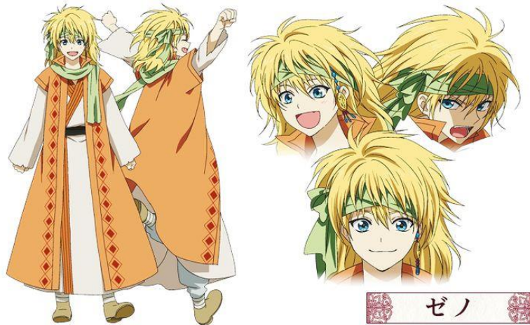
Zeno / Ouryu (Sumber: http://google.co.id/zeno-ouryu )

Karakter pemain naga terakhir adalah Zeno atau Naga Kuning. Wataknya juga sangat periang dan bersemangat. Kata Putri Yona, ia sangat cerah dan hangat seperti matahari. Zeno adalah shield (perisai) Putri Yona. Zeno memiliki wajah seperti anak-anak dengan mata yang sangat besar dan berwarna biru, memiliki rambut panjang berwarna kuning dengan ikat kepala berwarna hijau. Pada ikat kepalanya terselip kalung sang Raja Naga Merah (King Hirryuu). Zeno menggunakan desain jubah panjang dengan baju dalaman lengan panjang (Obi) dan berwarna orange.