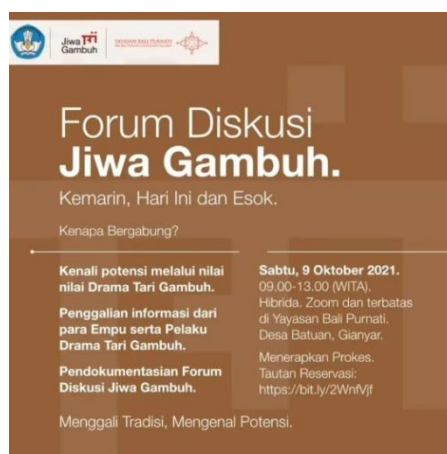
Gambar 03. Brosur Diskusi Gambuh

Sebelum pelaksanaan, terlebih dahulu diadakan rapat penyamaan persepsi program dengan pihak pemerintahan desa dinas Batuan, pihak seniman Desa Batuan, dan Yayasan Bali Purnati yang dilaksanakan pada tanggal 10-12 September 2021. Disepakati bahwasannya program pendokumentasian merupakan program pelestarian agar generasi berikutnya mengetahui, memahami, bertanggung jawab atas eksistensi Gambuh gaya Desa Batuan khususnya. Adapun jadwal penampilan masing-masing sekaa akan diuraikan sebagai berikut.