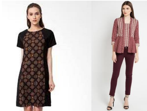
Gambar 2. Padu-padan Kain Batik Truntum

geometris berulang ini sangat luwes untuk digunakan dalam berbagai kesempatan atau acara, maka dari itu tak jarang batik truntum kini ditampilkan pada kegiatan sehari-hari misalnya oleh pegawai untuk bekerja. Motif batik truntum juga saat ini ditampilkan atau disajikan dengan berbagai warna. Kemudian dipadukan dengan kain yang lebih modern, bahkan dipadu-padankan dengan busana kasual untuk menghasilkan tampilan yang lebih kekinian tapi tetap terkesan etnik tanpa mengurangi nilai dari batik truntum tersebut.