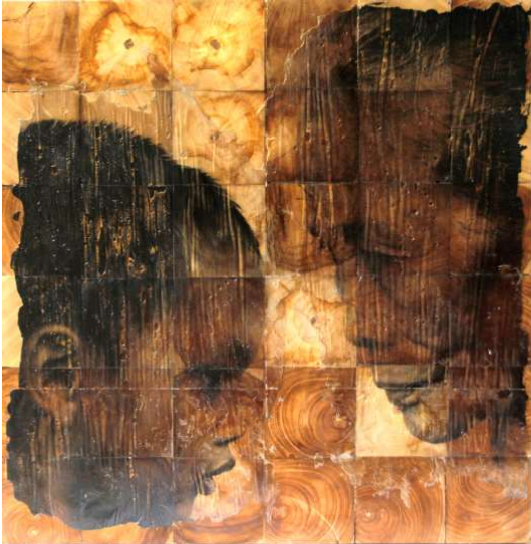
Karya Foto 4.1