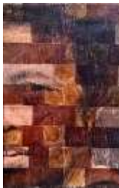
Gambar 3.17 Hasil foto yang telah jadi