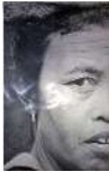
Gambar 3.15 Foto yang telah dicetak art paper (Dokumen Alit Adi Gora EP, 2016)