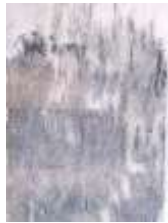
Gambar 3.16 penggosokan kertas dengan air