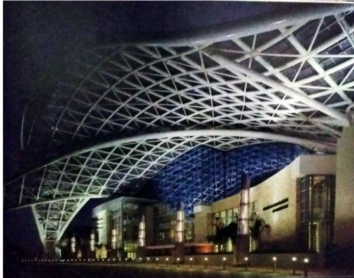
Gambar 2.1 Foto acuan karya 1

(Sumber : Buku Commercial Photography Handbook , hal : 24)