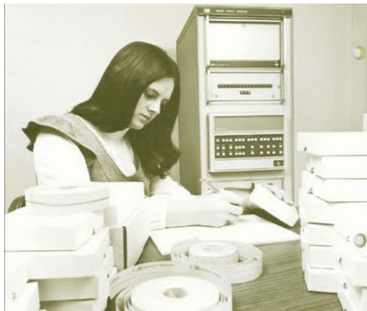
Gambar3. Suasana kantor sebelum internet ditemukan

Lebih melihat lebih ke dalam, perubahan sistem kantor konvensional sangat terlihat disini. Jika dahulu sebelum hadirnya internet kedalam sistem kerja kantor, masih ditemukan tumpukan kertas, lemari filig cabinet yang penuh arsip, meja-meja besar untuk peletakan fasilitas komputer yang juga berukuran besar, dan mesin ketik manual yang masih digunakan dengan segala kelemahannya. Waktu dan tempat sangat mengikat, dimana kehadiran manusia secara fisik baru bisa diakui dan diterima eksistensinya. Tenaga dan biaya yang besar dikeluarkan dengan harapan hasil yang sebanding diterima. Namun kehadiran internet yang memiliki keunggulan efektifitas dan efisiensi waktu serta ruang menjadi sebuah nilai lebih dalam menyelesaikan pekerjaan perkantoran modern.