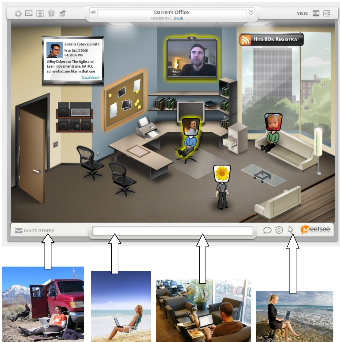
Gambar 4. Skema System Virtual Office

Hal ini tentu saja bisa menekan biaya untuk perluasan ruang jika terjadi penambahan jumlah karyawan untuk meningkatkan produktivitas. Selain itu, biaya maintenance atau perawatan fisik bangunan juga bisa direduksi.