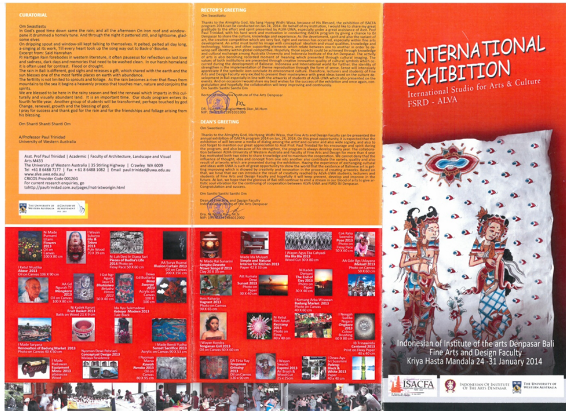
Gambar 1. Katalog Pameran Tampak Depan