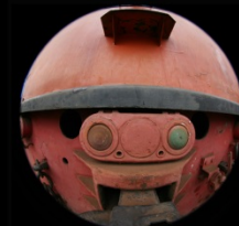
Mr T 50 X 40 PHOTO PAPER